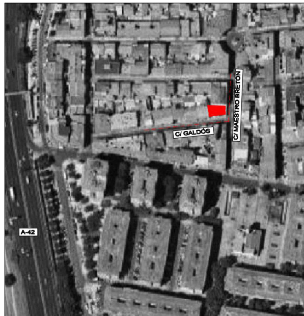
2 SITUACION EN EL MUNICIPIO Escala: S/E